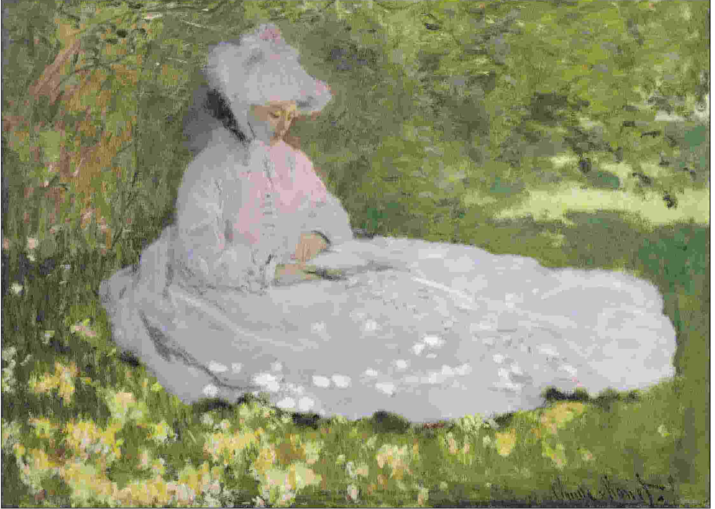
Claude Monet, "Primavera", 1872 (Walters Art Museum, Baltimora)

Ritaglio stampa ad uso esclusivo del destinatario, non riproducibile.